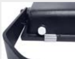
Ademend ventiel (gaat condens tegen)