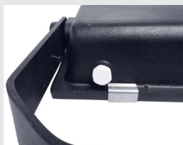
Ademend ventiel (gaat condens tegen)