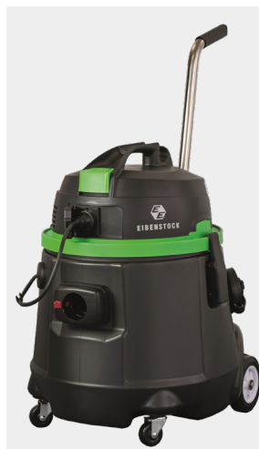
Pompzuiger EPS 50