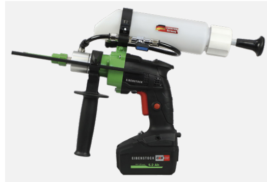
Accu tegelboormachine END 40A Artikelnr. 10.093.12